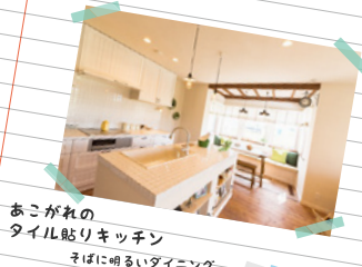
あこがれの タイル貼りキッチン そばに明るいダイニング があるといいな。