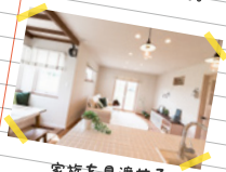
家族を見渡せる アイランドキッチン